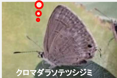
クロマダラソテツジミ