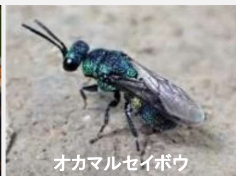
オカマルセイボウ