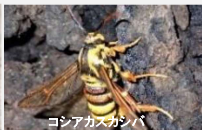
コシアカスガシバ