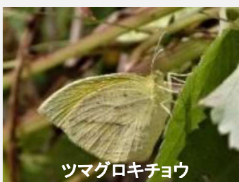
ツマグロキチョウ